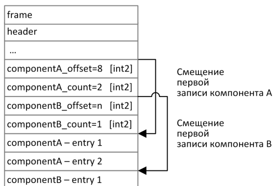
Рисунок 2. Схема сообщения с двумя повторяющимися компонентами

Повторяющимся компоненту или полю всегда предшествуют два поля — offset и count . Поле count содержит количество записей. Поле offset указывает на смещение (в байтах) первой записи компонента относительно начала данного поля; его значение не может быть меньше 4.